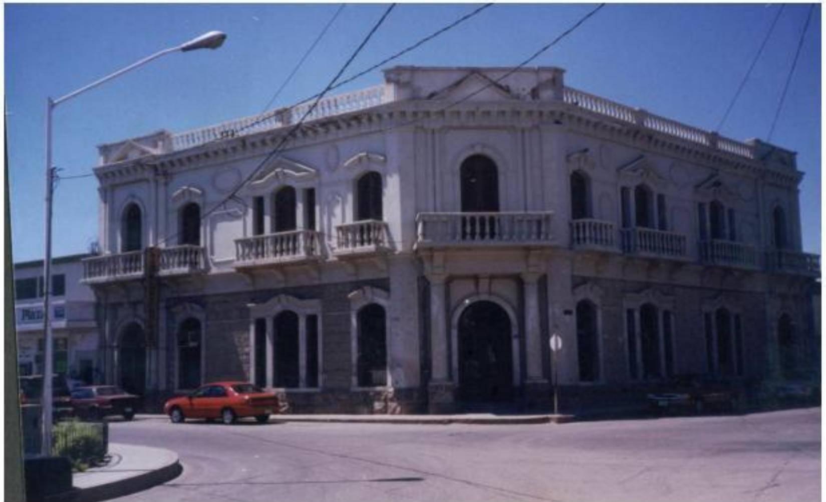
Edificio del Banco Occidental de México, S. A.