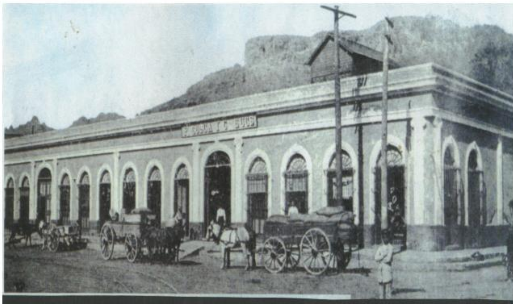
Pedro Cosca y Cia. Sucs.