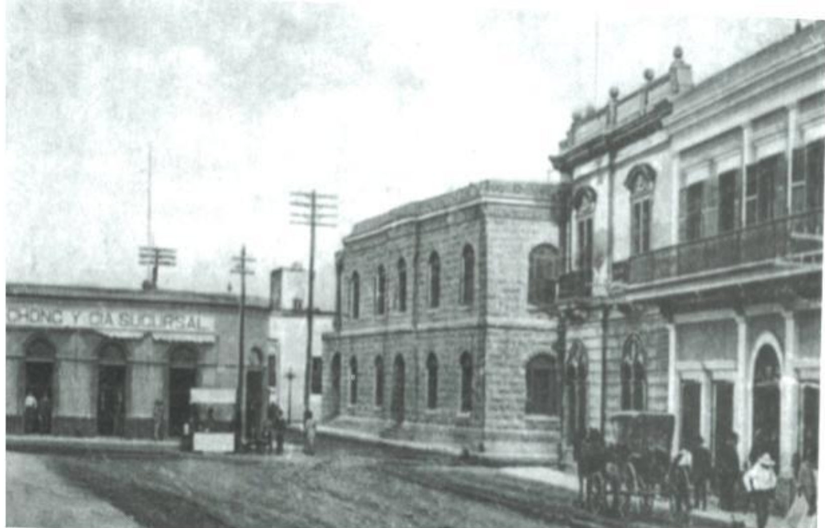
Serdán y calle 22