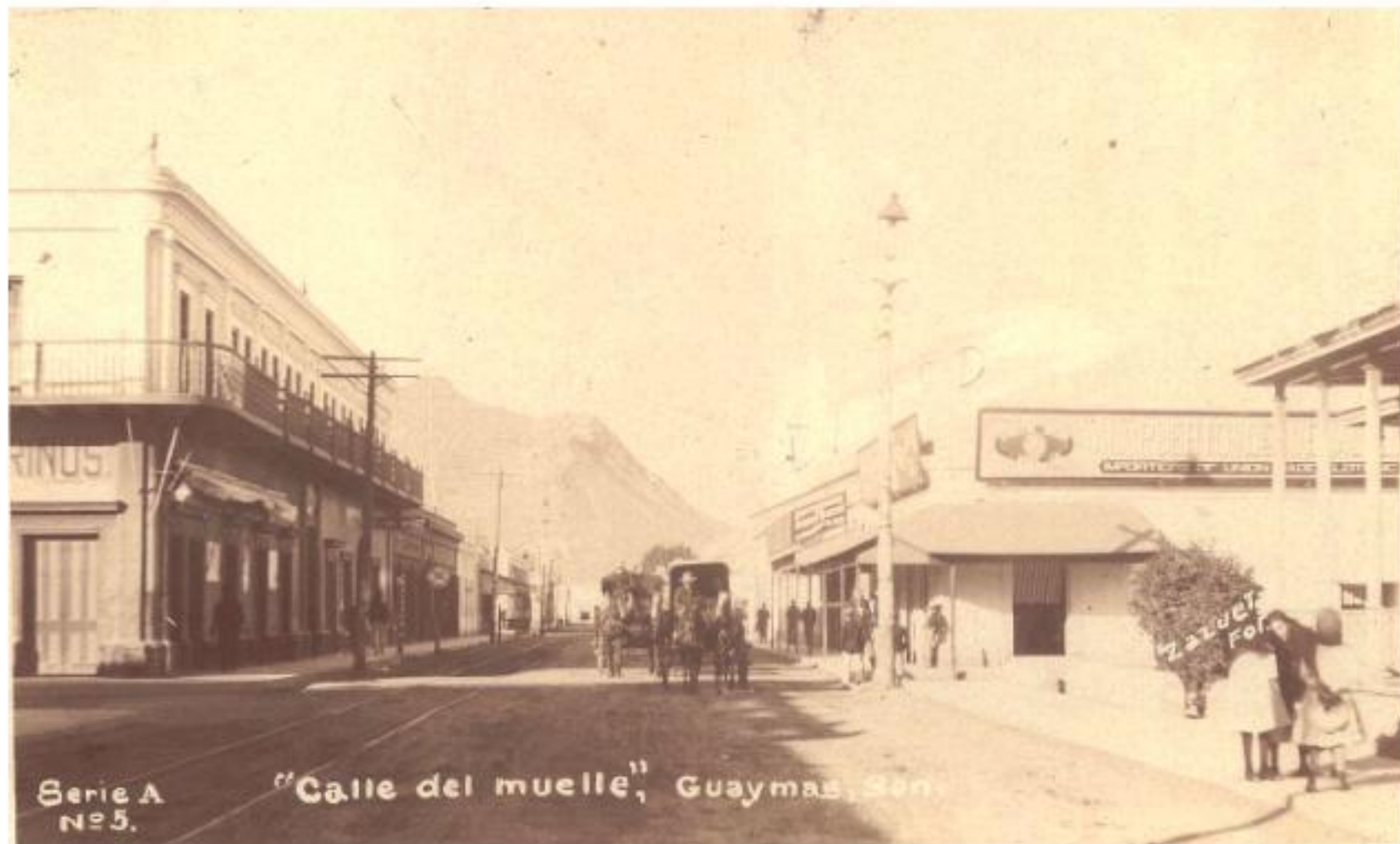
Calle del muelle y 21