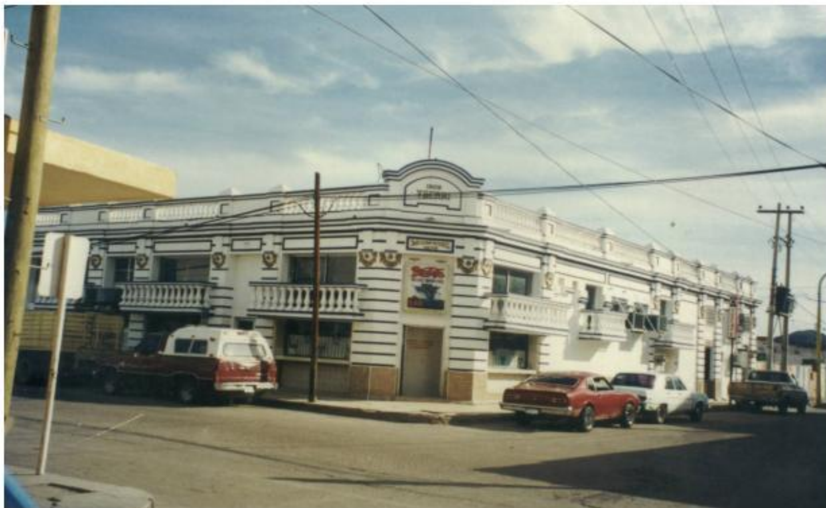
Aspecto actual de la tienda “La Francesa”