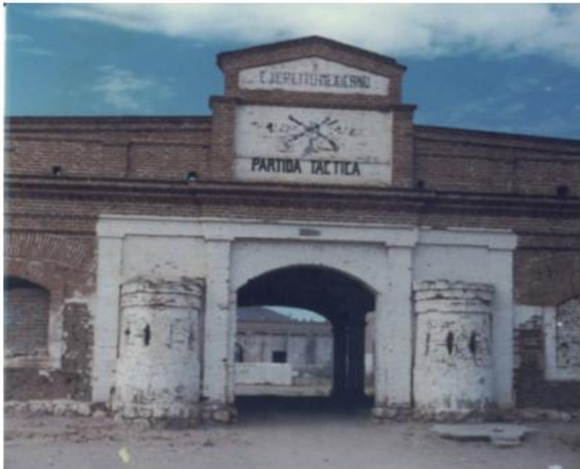
El Cuartel de Ortiz