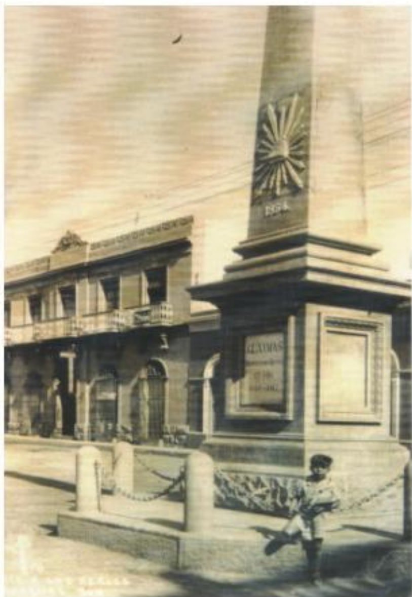
Vista del Obelisco