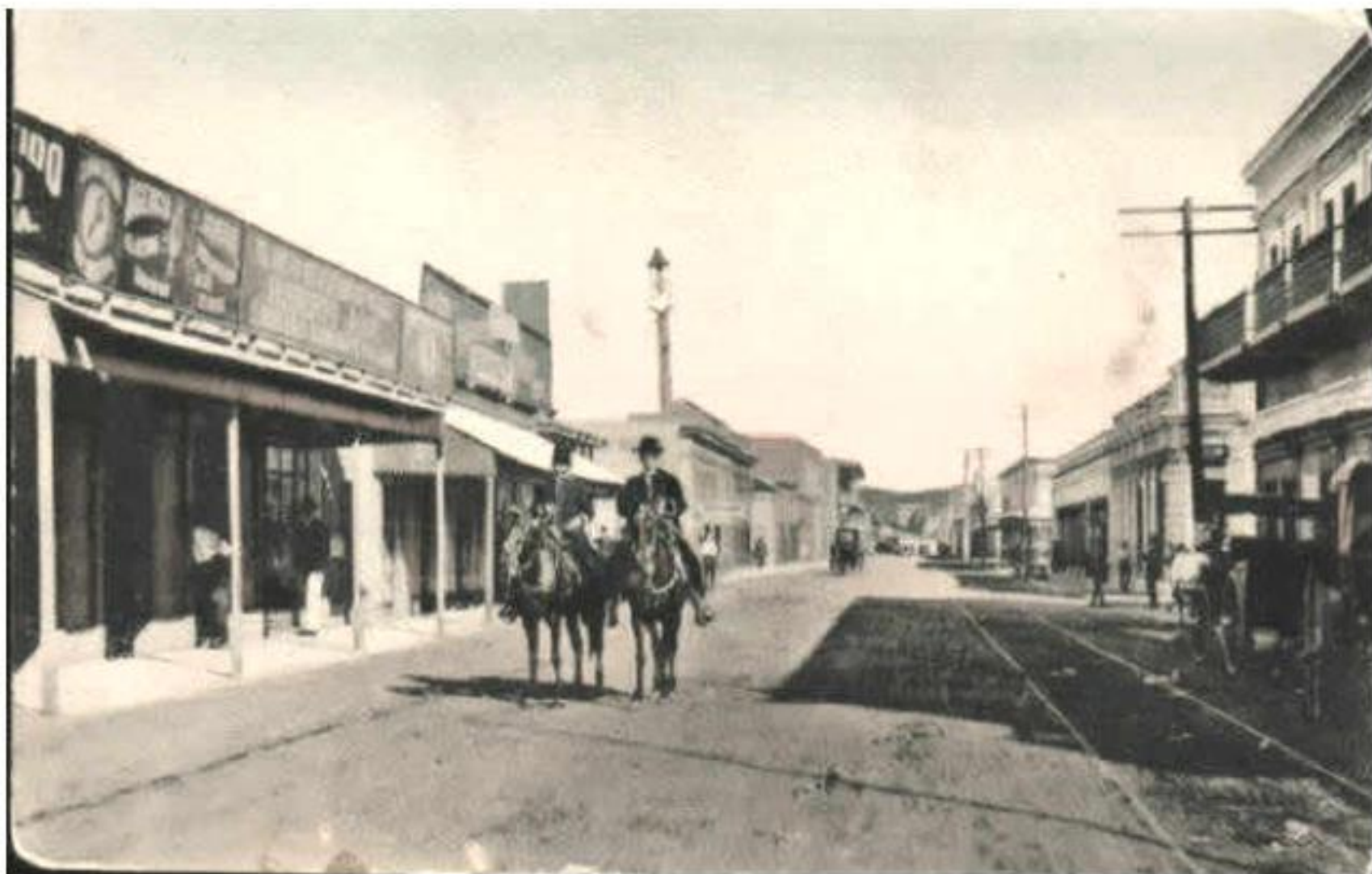
Calle del Muelle (A.L.R.)