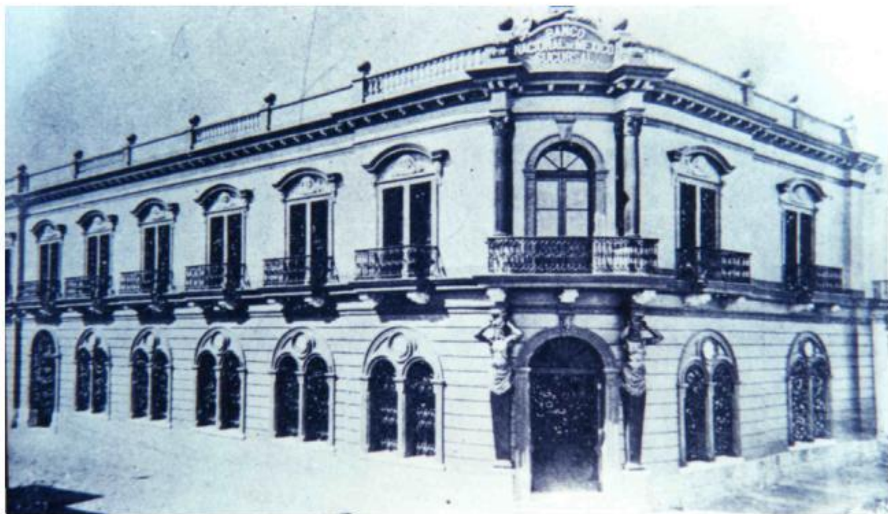
Banco Nacional de México