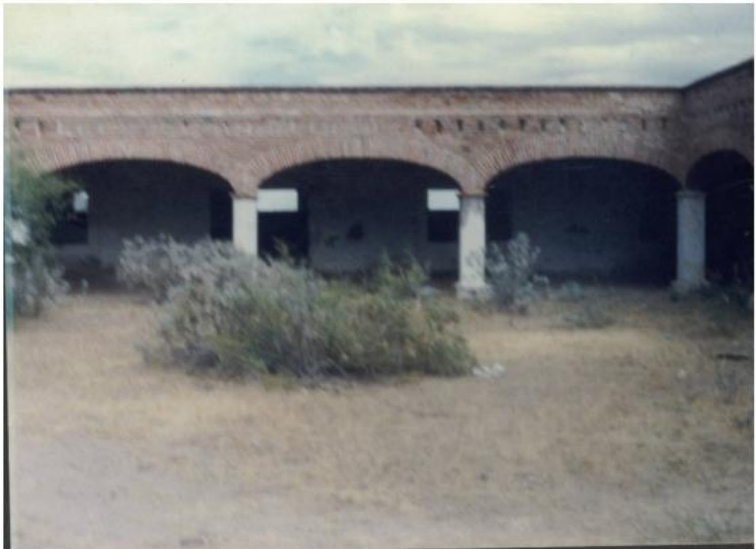
Interior del cuartel