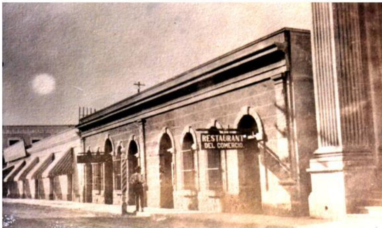
Calle 21 junto al Banco de Sonora