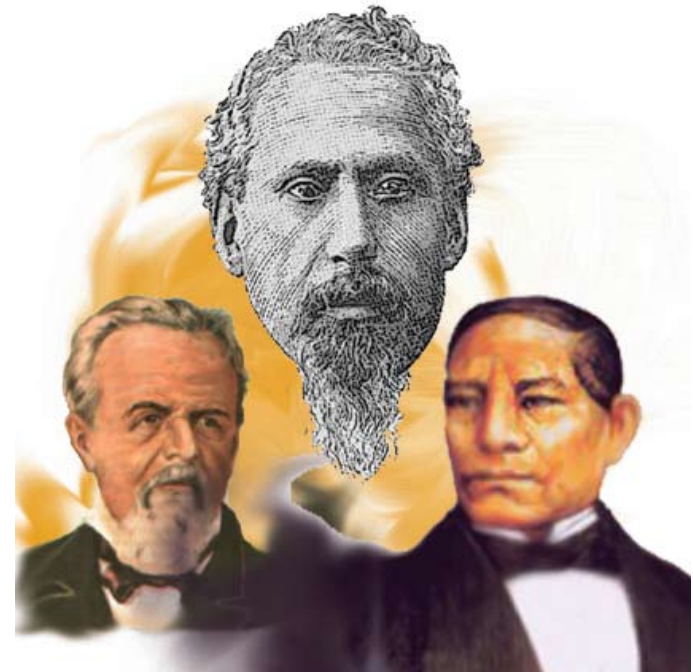
De izquierda a derecha: Guillermo Prieto, Ignacio Ramírez y Benito Juárez