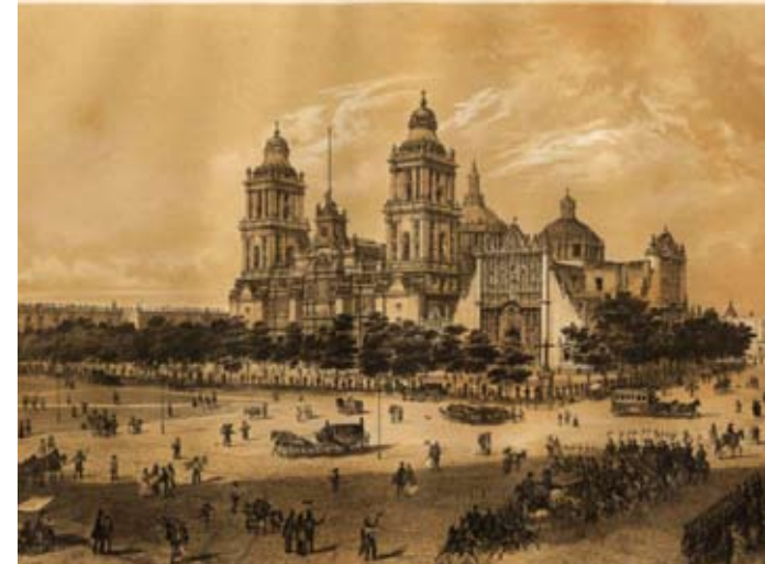
Catedral Metropolitana de la Ciudad de México